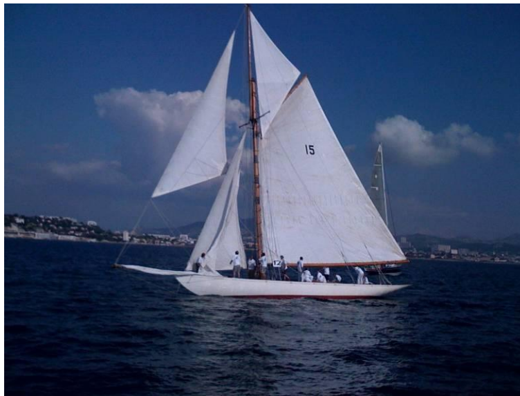
Le Collège des Architectes Experts sur le Nan of Fife

Longueur hors tout 24,95 m Longueur de coque 19,25 m Longueur à la flottaison 13,47 m Maître Bau 3,53 m Tirant d'eau 2,60 m Lest en plomb 12,85 t Franc-bord avant pont 1,24 m Franc-bord arrière 1,15 m Élancement avant 2,07 m Élancement arrière 3,68 m